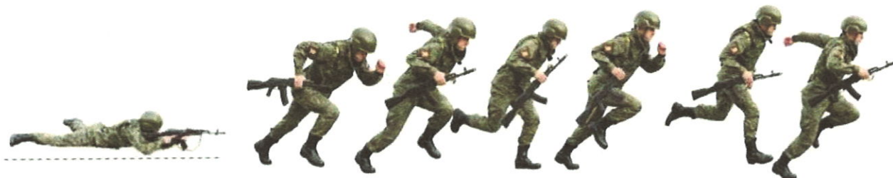
Рисунок 5. Порядок выполнения старта комплексного соревнования военно-прикладного характера «Квадрат»

1 этап: с площадки старта (квадрат-1) участник команды из положения лежа, МГМ АК-74 с пристегнутым магазином в правой руке, бежит (рисунок 5) короткими перебежками по кривой дорожке (40 м), имеющей четыре зигзага, (дистанция дорожки обозначена лентой, зигзаги флажками), до площадки (квадрат-3), участник команды переводит МГМ АК-74 с пристегнутым магазином в положение «за спину» (невыполнение штраф – 10 сек). Допускается перевод МГМ АК-74 в положение «за спину» в движении до площадки (квадрат-3) и прикладом в верх.