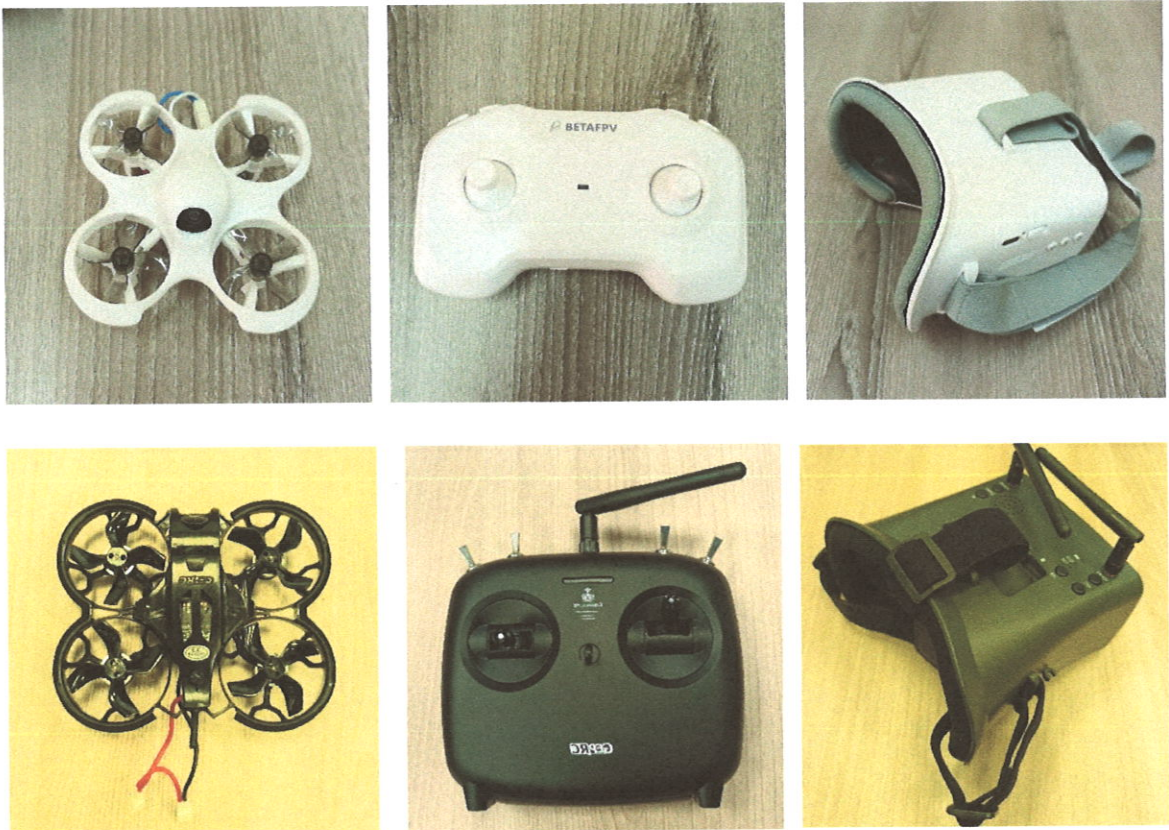
Рисунок 7. БПЛА квадрокоптерного типа для полета в FPV-режиме.