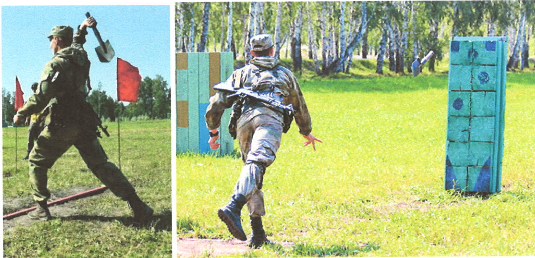
Рисунок 3. Порядок выполнения метания малой пехотной лопаты на точность с места

участника команды. (сначала считается, у кого из участника команды 10 баллов, потом 7 баллов и 4 бала).