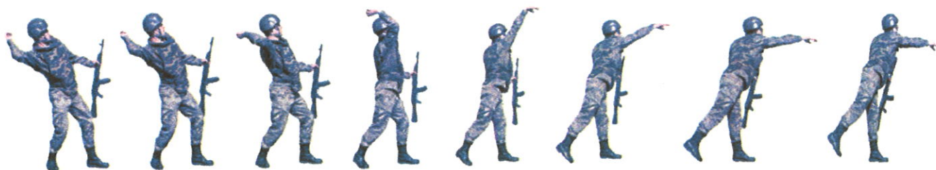
Рисунок 6. Порядок выполнения метания гранат на точность Определение результатов

(При метании гранаты стоя с места надо встать лицом к цели; гранату взять в правую, а оружие в левую руку, сделать правой ногой шаг назад, согнув ее в колене, и, поворачивая (как бы закручивая) корпус вправо, произвести замах гранатой по дуге вниз и назад; быстро выпрямляя ногу и поворачиваясь грудью к цели, метнуть гранату, провозжая ее над плечом и выпуская с дополнительным рывком кисти. Тяжесть тела в момент броска перенести на левую ногу, оружие энергично подать назад).