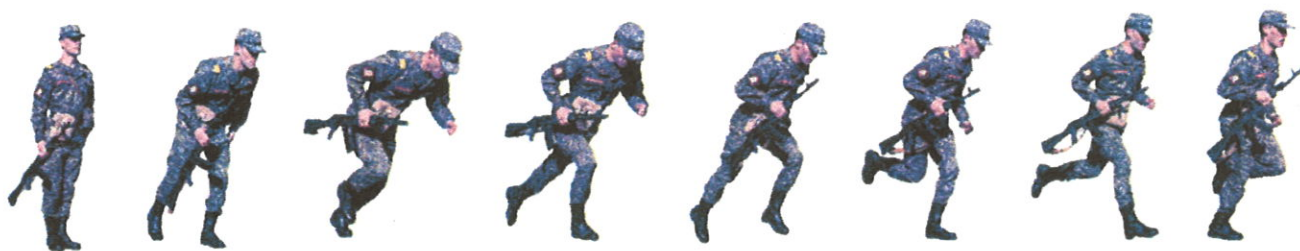
Рисунок 2. Порядок выполнения старта эстафеты (челночный бег 4х200 м с оружием)

Первое место занимает команда с наименьшим временем прохождения эстафеты с учетом времени штрафов. Время финиша команды учитывается до сотых секунд.