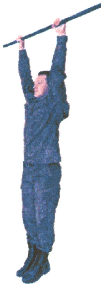
Рисунок 1. Подтягивание на перекладине

По количеству повторений. При нарушении условий выполнения упражнения повторение не засчитывается. Побеждает команда, выполнившие наибольшее количество силовых повторений, т.е. сумма повторений всех участников команды (засчитанных судьей). При равенстве суммы силовых повторений 2-х и более команд, окончательное место определяется по наибольшей сумме личных подтягиваний (силовых повторений) каждого участника команды.